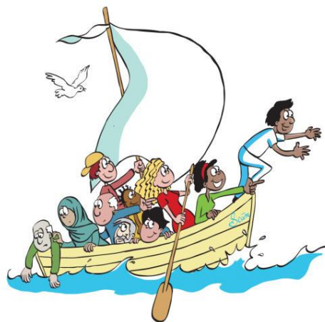
L'aventure de la vie en communauté.